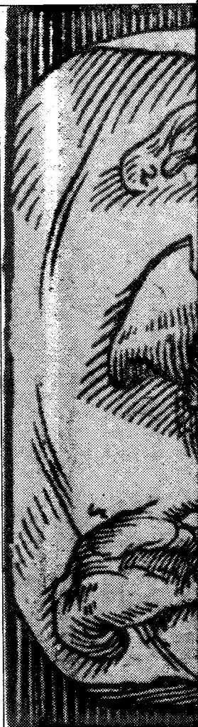
Vnější a vnitřní smysly člověka ( Orbis sensualium pictus , 1679)